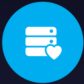
SERVER HEALTH MONITORING