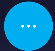
AND MANY MORE