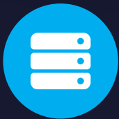
SERVER ROOM MONITORING